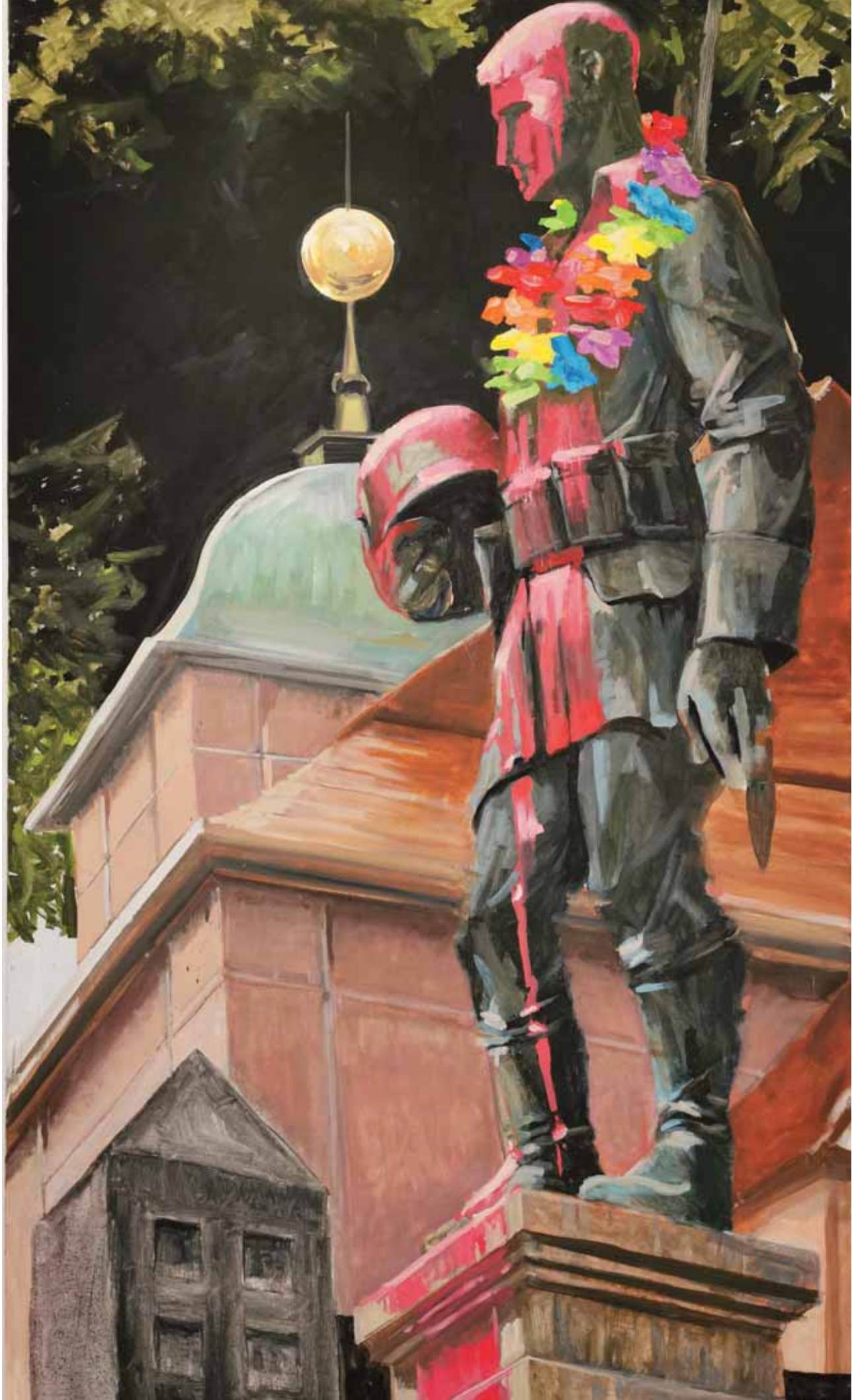
CSD Vorbereitung Schöneberg