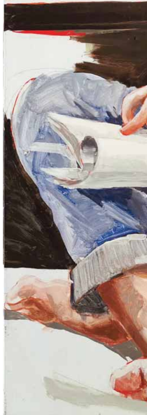
Frederick Lau 2019, Öl / Lwd. 120 x 150 cm