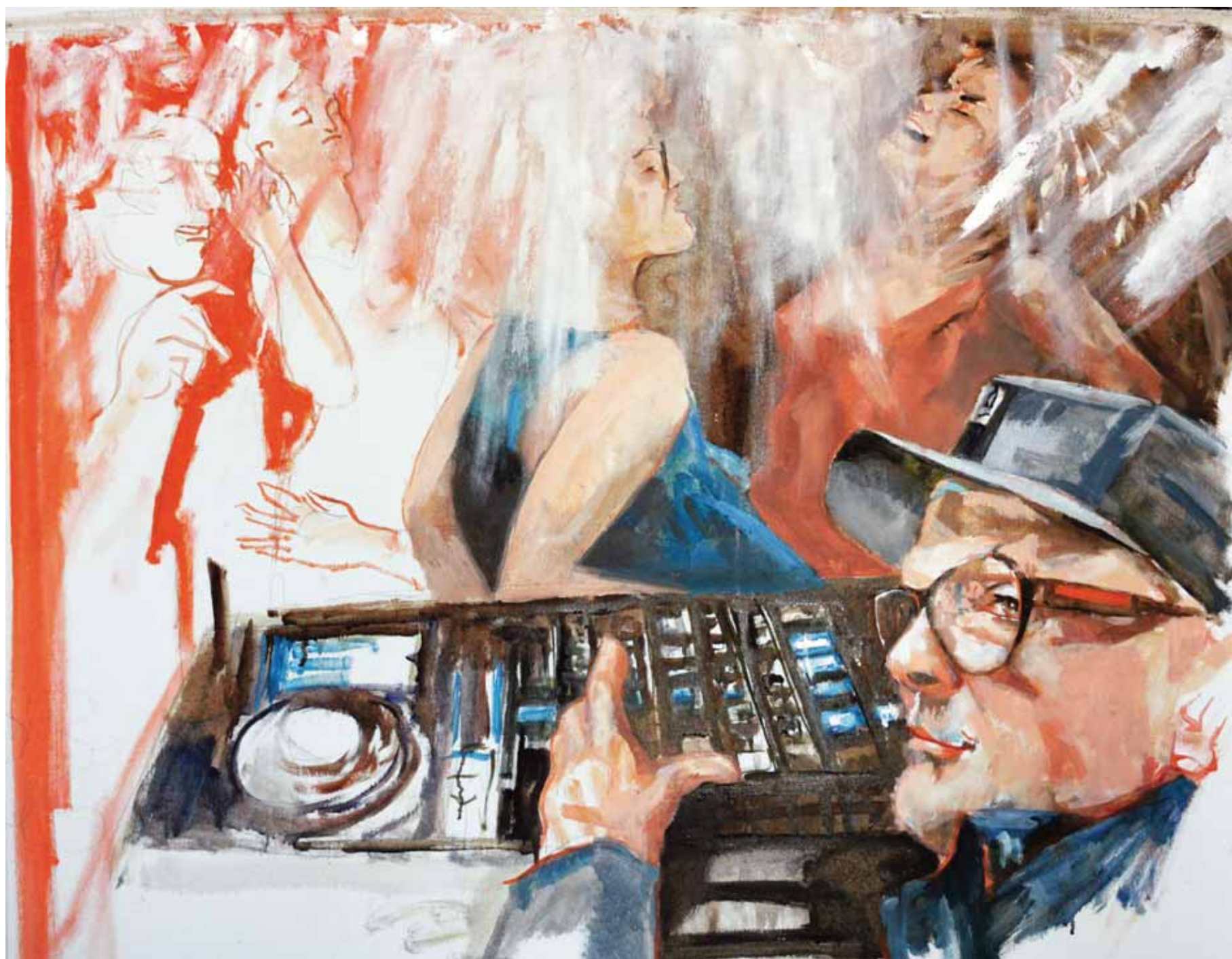
Portrait DJ WestBam